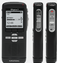
Mobiles Diktieren: Digta 7

Mit allen Digta Diktiergeräten variabel kombinierbar: